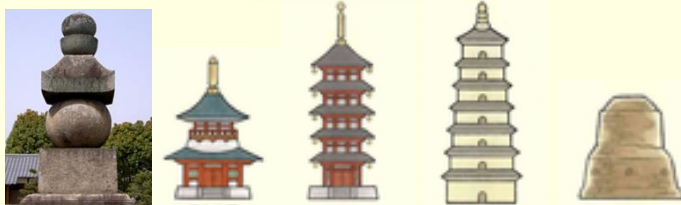
五輪塔 ← 大塔 ← 五重塔 ← 大雁塔 ← グメークストウーパ (日本) (日本) (中国)

インドの円いストウーパがシルクロードを通り中国・日本へと伝わる中で「五重塔」や「大塔」等成形を変え